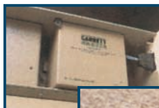
Modulo delle batterie, # 2225700 conveniente funzionamento con batterie da 12V