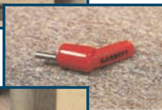
Operational Test Piece (OTP), # 1600600 progettato per le richieste FAA