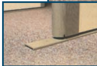
Base stabilizzante, # 1603900